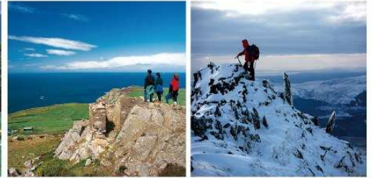
NATIONAL PARKS WALES Britain's breathing spaces